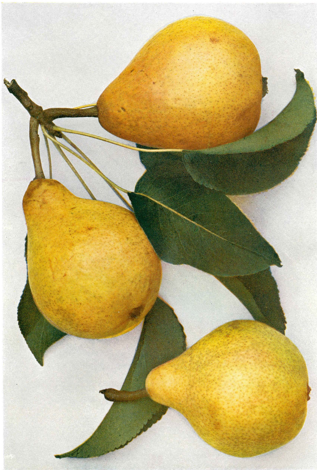
ŘÍHA, Jan, České ovoce I. Hrušky, 3, nezměněné vyd. Praha: Čsl. grafická unie, 1937. ANANASKA COURTRAYSKA – Ananasbirne von Courtray . – P. Ananas de Courtray .