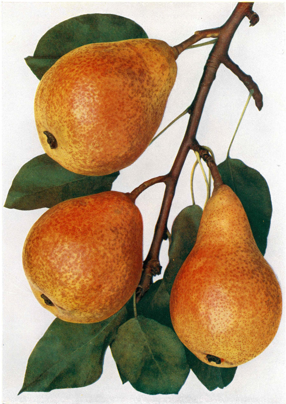
ŘÍHA, Jan. České ovoce I. Hrušky. 3. nezměněné vyd. Praha: Čsl. grafická unie, 1937. FULVIE - Neue Fulvie . - Nouvelle Fulvie .