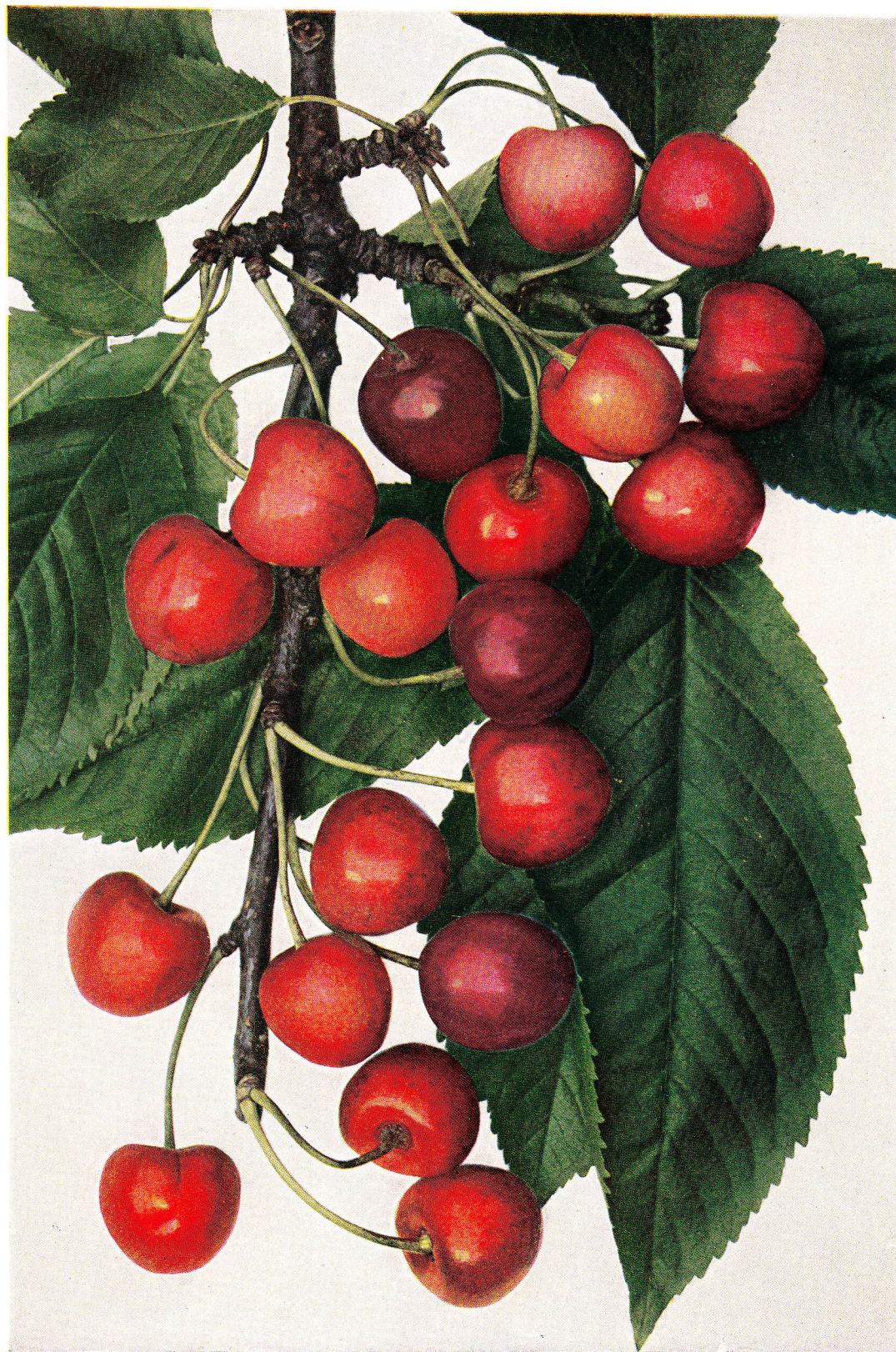
LYONSKÁ RANÁ – Hâtive de Lyon.