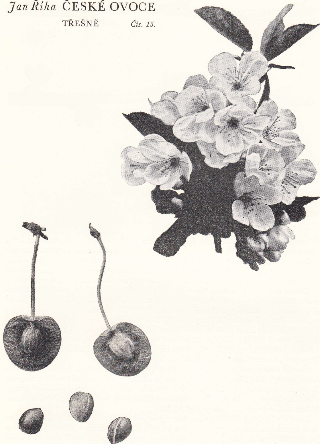
KLECANSKÁ ČERNÁ – Srdcovka