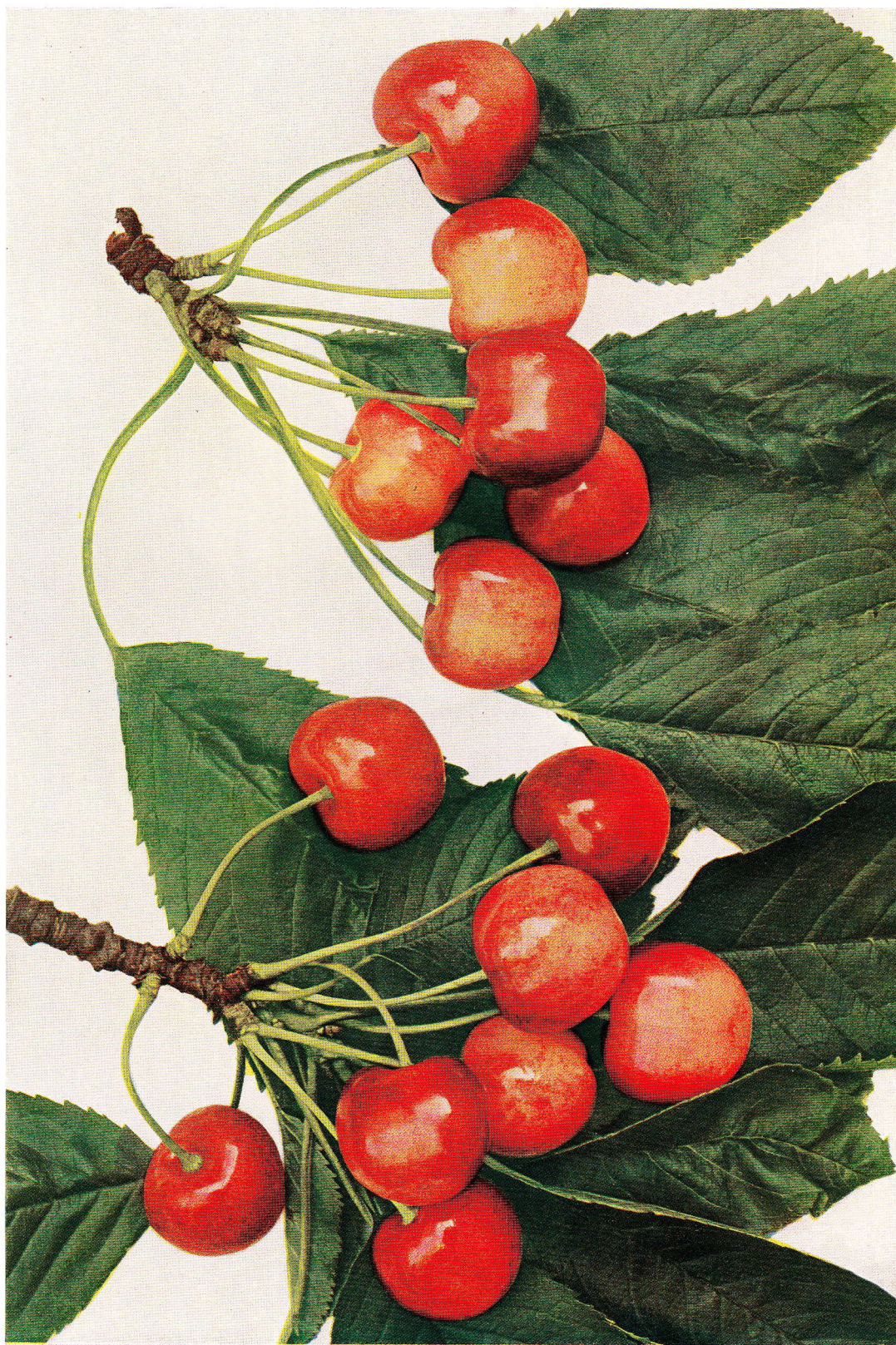
GROLLOVA CHRUPKA – Groll's bunte Knorpelkirsche. – Bigarreau Groll.