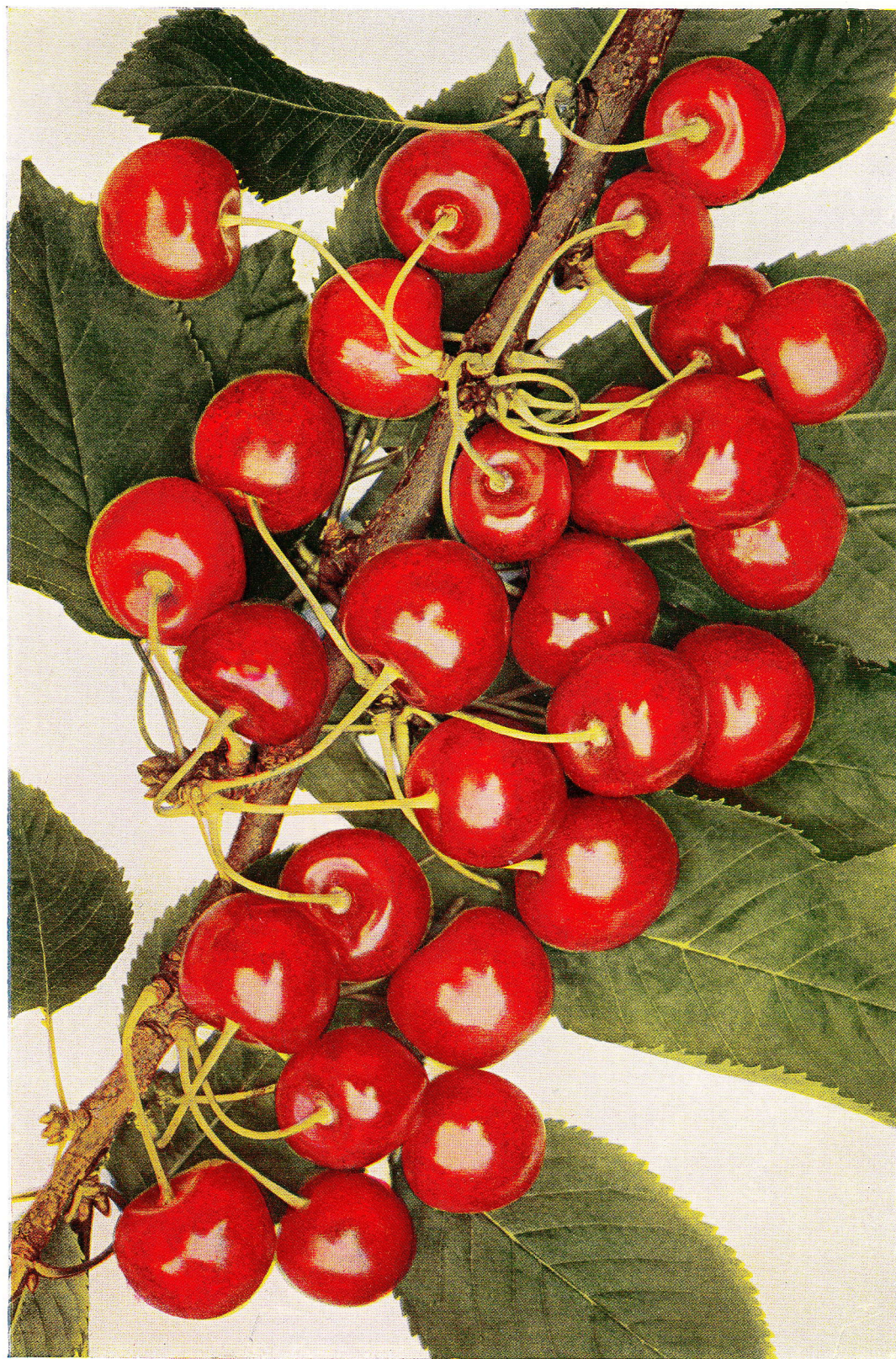
CÍSAŘE FRANTIŠKA CHRUPKA

Kaiser Franz Knorpelkirsche. – Bigarreau Empereur François.